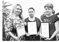
В ходе профессиональной ярмарки мастера рассказали о своих услугах и показали образцы своей работы. Ярмарка была очень успешной.

В селе царит атмосфера любви и взаимопомощи. Жители всегда готовы прийти на помощь соседу. Это делает село по-настоящему уютным и гостеприимным.