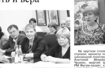
В ходе встречи с судьей обсуждались вопросы законности и правопорядка. Судья ответила на вопросы граждан.