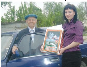
Фото - факт из архива редакции. 8 мая 2008 года.

Но неумолимое время не щадит ветеранов той жестокой войны. Все меньше и меньше остается их в строю живых.