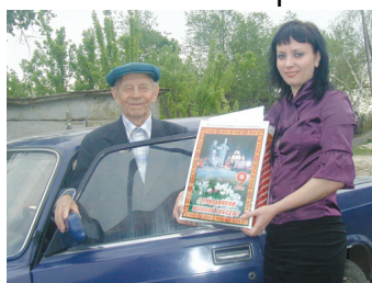
8 мая 2008 года.

Но неумолимое время не щадит ветеранов той жестокой войны. Все меньше и меньше остается их в строю живых.